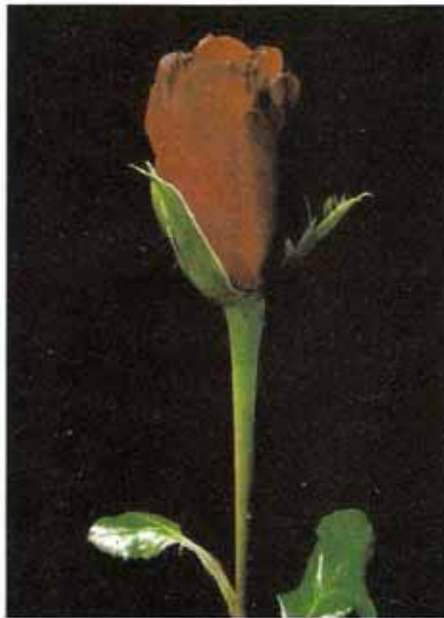
स्थानीय बाजार हेतु पुष्प डण्डी काटने की अवस्था