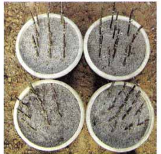
स्टेंटिंग विधि द्वारा गुलाब का प्रवर्धन