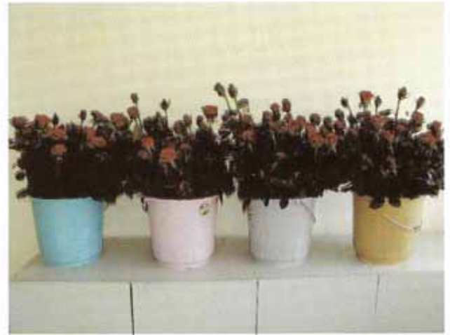
शीतगृह में 4° सेंटीग्रेड तापमान पर गुलाब कर्तित पुष्प का भण्डारण का दृश्य

से बांध दिया जाता है। इसके बाद इन बंडलों को लम्बाई के आधार पर विभिन्न आकार के गत्ते के बाक्स में पैक करके बाजार में भेज दिया जाता है। स्थानीय बाजार में इसका पुष्प बेचने के लिए प्रयास करना चाहिए कि ट्रांसपोर्टेशन रात के समय हो। यदि बाजार में गुलाब के पुष्प की कीमत अच्छी न मिल रही हो तो शीतगृह में 2° सेंटीग्रेड तापमान पर लगभग 1 सप्ताह तक पुष्प का भण्डारण किया जा सकता है।