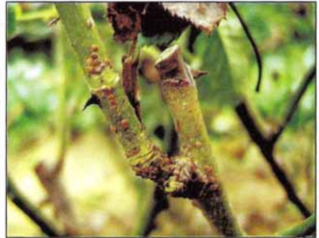
रेड स्केल से प्रभावित गुलाब की शाखा

गुलाब के पौधों पर रेड स्केल का प्रकोप बहुत ज्यादा होता है। यह कीड़ा तनों पर चीपक कर पौधों से रस चूसते हैं। कुछ समय बाद तना सूखना शुरू हो जाता है तथा धीरे-धीरे गुलाब के पौधे मर जाते हैं। यह कीड़ा ठण्डे वातावरण में गुलाब की खेती करने पर ज्यादा सक्रिय देखा गया है। इससे बचाव के लिए रोगर 1 से 1.5 मिलीलीटर या मोनोक्रोटोफास 1 से 1.5 मिलीलीटर प्रति लीटर पानी में घोलकर पौधों पर छिड़काव करना चाहिए।