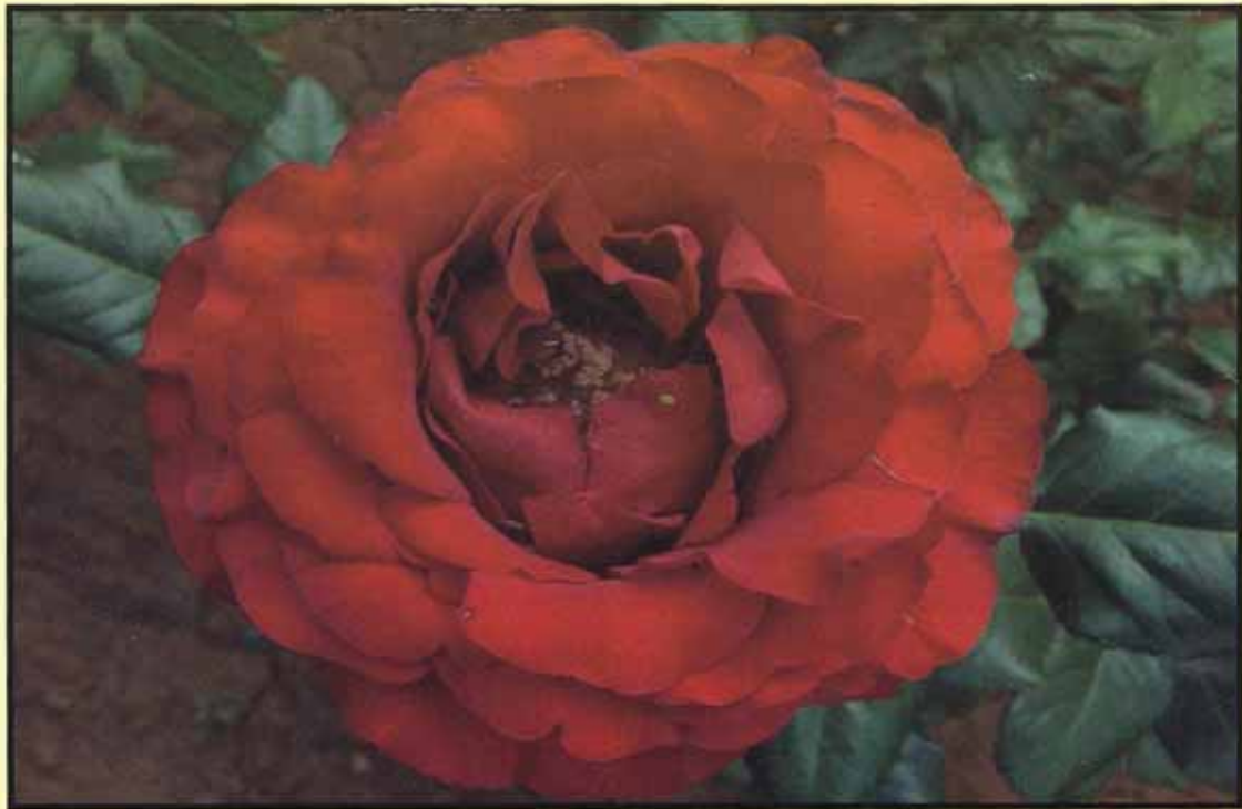
गुलाब की किस्म फस्ट रेड का पुष्प