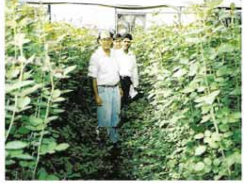
पॉलीहाउस में हाइब्रिड 'टी' गुलाब को सहारा देने के उपरान्त सीधा पुष्प डण्डी का उत्पादन

लाल मकड़ी गुलाब के पौधों में शुरू में पत्तियों के नीचले भाग पर दिखती हैं तथा बाद में सम्पूर्ण पौधों पर फैल जाती हैं। यह पत्तियों से रस चूसने का काम करती हैं जिसके कारण लाल मकड़ी से प्रभावित पौधों की पत्तियाँ हरे से भूरे रंग में होने लगती हैं। गुलाब पर लाल मकड़ी का प्रकोप गर्मी के मौसम में अधिक तापमान होने तथा वातावरण में कम आर्द्रता होने के कारण होता है। इसकी रोकथाम के लिए पॉलीहाउस में फुहार सिंचाई विधि से वातावरण में आर्द्रता बढ़ा देना चाहिए। ऐसा करने से लाल मकड़ी का प्रकोप कम हो जाता है। गुलाब के पौधों पर हिल्फोल 1.0 मिलीलीटर