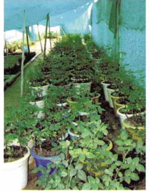
चश्मा विधि द्वारा तैयार पौध सामग्री

यह गुलाब की बहुत ही नई विधि है। दिन-प्रतिदिन इस विधि का उपयोग बढ़ता जा रहा है। यह विधि यूरोप से शुरू हुई और आज हमारे देश में भी बहुत प्रचलित होती जा रही है। इस विधि में मूलवृन्त की 1 वर्ष पुरानी तना मातृपौध से काटकर अलग कर लेते हैं इसके उपरान्त उस तना से पेंसिल के मोटाई की 22.5 सेंमी. लम्बी कलम तैयार करते हैं। इसके बाद साइन से कलिका का चुनाव करके 'टी' चश्मा विधि से चश्मा बांध देते हैं। इस विधि में मूलवृन्त में जड़ों का फुटाव एवं मूलवृन्त तथा कलिका का जुड़ना एक साथ होता है। चश्मा चढ़ाने के उपरान्त इसे बालू में रोपित कर देते हैं। इस प्रकार 3 से 4 महीने में गुलाब का पौधा रोपण के लिए तैयार हो जाता है।