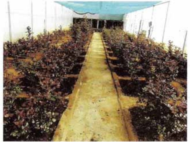
गुलाब के 2 वर्ष पुराने पौधों की कटाई-छंटाई करने के बाद नई पुष्प डण्डियों के फुटाव का दृश्य

गुलाब की खेती करने के लिए इसके पौधों की कटाई-छंटाई बहुत ही महत्वपूर्ण है। इसके पौधों से रोपण के पश्चात् नयी शाखाएं निकली हैं। इन सभी शाखाओं को नीचे से 8-10 सेंमी. छोड़कर नीचे के तरफ बेंड (झुकना) कर देते हैं। ऐसा करने से प्रत्येक पौधों से अनेक नई शाखाएं निकलती हैं तथा पौधों पर अधिक शाखाएं होने पर पुष्प उत्पादन की उपज बढ़ जाती है। जब पौधों पर अधिक शाखाएं इस प्रकार विकसित हो जाती है उसके उपरान्त प्रत्येक पौधा से 3 से 4 स्वस्थ शाखा को लगभग बेंडिंग प्वाइंट से 10 से 12 सेंमी. छोड़कर काट देते हैं। इस प्रकार नये पौधों में कटाई-छंटाई की जाती है। गुलाब में कटाई-छंटाई का समय मैदानी क्षेत्र में सितम्बर से अक्टूबर तथा पहाड़ी क्षेत्र में मार्च के महीना में की जाती है। कटाई-छंटाई के दौरान सुखी शाखाओं को काट देना चाहिए। गुलाब की पतली शाखाओं को पुष्प उत्पादन के लिए ट्रेन नहीं करना चाहिए। इसके पौधों को काटने-छंटने के तुरन्त बाद फफूंदीनाशक कैप्टान 2 ग्राम प्रति लीटर पानी में घोलकर छिड़काव करना चाहिए।