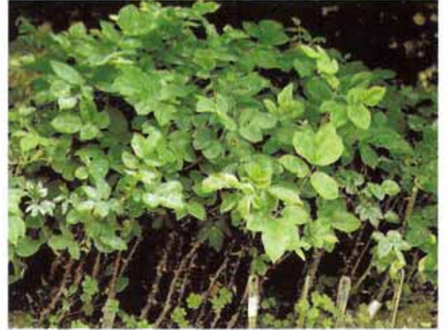
गुलाब का कलम विधि द्वारा प्रवर्धन

यह सबसे सरल एवं कम लागत वाली विधि है। इस विधि द्वारा पुष्प उत्पादक स्वयं पौधे बना सकते हैं। इस विधि में 1 वर्ष पुरानी स्वस्थ कलमों का इस्तेमाल किया जाता है। कलम की औसत लम्बाई 9 इंच एवं मोटाई पेंसिल जैसी रखी जाती है। कलमों में अच्छी जड़ के फुटाव के लिए एनएए, आईबीए, आईएए इत्यादि जैसे जड़ों को बढ़ावा देने वाले वृद्धि नियामकों का इस्तेमाल किया जाता है। इन वृद्धि नियामकों से कलमों के निचले भाग को पाउडर या घोल के रूप में उपचारित किया जाता है। कलम लगाने योग्य तैयार होने के बाद उसे बालू, वर्मीकुलाइट, परलाइट इत्यादि मीडिया में लगा दिया जाता है। कलम लगाने के बाद धूप तेज होने पर ऊपर से 50 प्रतिशत का ग्रीन शेड नेट लगा देना चाहिए। कलमों में फुटाव शुरू होने तक फुहार विधि से दिन में 2 से 3 बार हल्की सिंचाई करनी चाहिए। कलमों में अच्छी तरह जड़ें एवं तना विकसित होने के बाद अन्य स्थान पर क्यारी या पॉलीवैग में रोपित कर देते हैं। कलम द्वारा तैयार पौधे पुष्प उत्पादन में कम समय लेते हैं तथा मातृ पौधे जैसा ही पुष्प उत्पादन करते हैं।