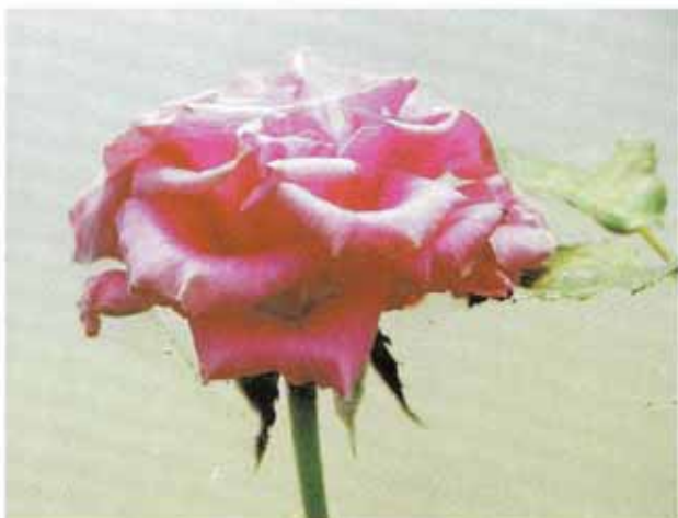
लाल मकड़ी से प्रभावित गुलाब का पुष्प