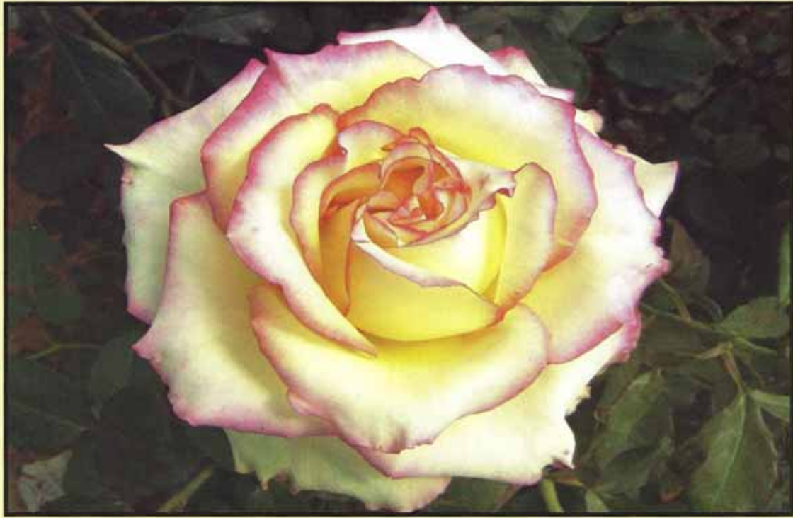
गुलाब की किस्म कन्फीटी का पुष्प