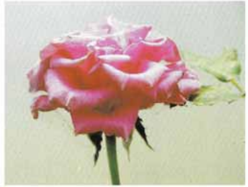
लाल मकड़ी से प्रभावित गुलाब का पुष्प