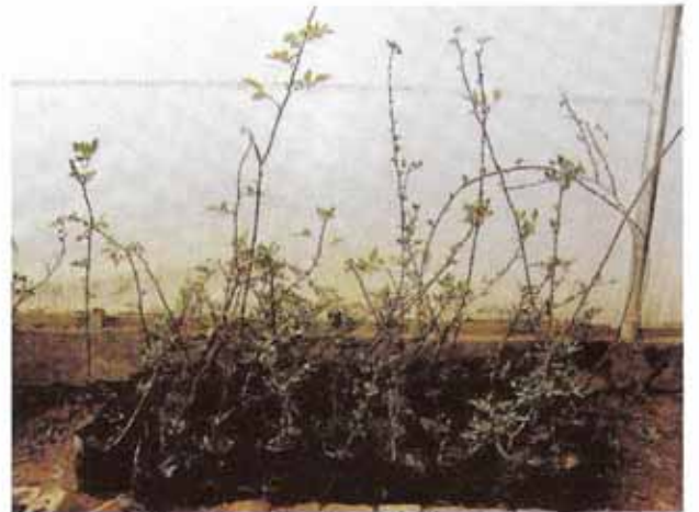
रोजा इण्डिका वराइटी ओडराटा के मूलवृन्त

हमारे देश में चश्मा या ग्राफ्टिंग विधि में मूलवृन्त के रूप में रोजा इण्डिका वराइटी ओडराटा और रोजा मल्टिफ्लोरा सर्वाधिक उपयोग किया जाता है। यूरोप में रोजा कैनिना , रोजा मल्टिफ्लोरा , रोजा मैनेटी एवं रोजा रेगोसा सामान्यतौर पर मूलवृन्त हेतु इस्तेमाल किया जाता है। मूलवृन्त हेतु इस्तेमाल होने वाले गुलाब के पौधों में मिट्टी से पोषक तत्व एवं पानी लेने तथा साइन भाग की अच्छी वृद्धि करने की क्षमता होनी चाहिए।