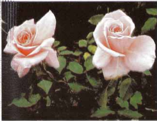
गुलाब के पुष्प डण्डी को काटने की अवस्था से 1 दिन बाद की स्थिति