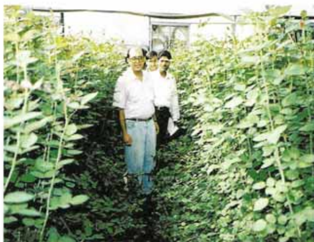
पॉलीहाउस में हाइब्रिड 'टी' गुलाब को सहारा देने के उपरान्त सीधा पुष्प डण्डी का उत्पादन

लाल मकड़ी गुलाब के पौधों में शुरू में पत्तियों के नीचले भाग पर दिखती हैं तथा बाद में सम्पूर्ण पौधों पर फैल जाती हैं। यह पत्तियों से रस चूसने का काम करती हैं जिसके कारण लाल मकड़ी से प्रभावित पौधों की पत्तियाँ हरे से भूरे रंग में होने लगती हैं। गुलाब पर लाल मकड़ी का प्रकोप गर्मी के मौसम में अधिक तापमान होने तथा वातावरण में कम आर्द्रता होने के कारण होता है। इसकी रोकथाम के लिए पॉलीहाउस में फुहार सिंचाई विधि से वातावरण में आर्द्रता बढ़ा देना चाहिए। ऐसा करने से लाल मकड़ी का प्रकोप कम हो जाता है। गुलाब के पौधों पर हिल्फोल 1.0 मिलीलीटर