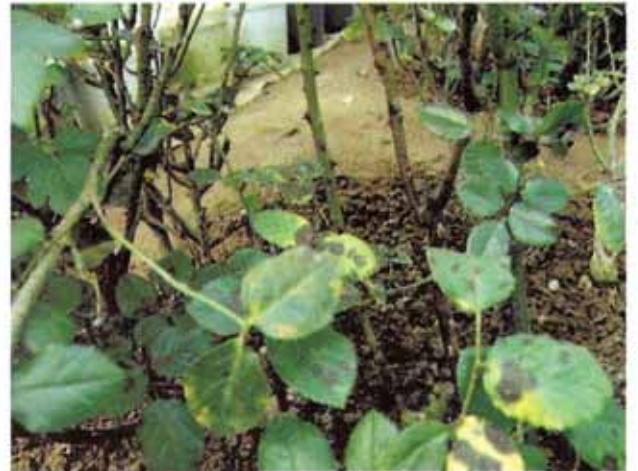
ब्लैक स्पॉट से प्रभावित गुलाब के पौधे

ब्लैक स्पॉट वातावरण में अधिक आर्द्रता होने पर गुलाब के पौधों को ज्यादा प्रभावित करता है। इसका प्रकोप होने पर पत्तियों पर काले रंग के धब्बे पड़ जाते हैं तथा पत्तियाँ झड़ना शुरू हो जाती हैं। इससे प्रभावित गुलाब के पौधों की बढ़वार बिल्कुल ही धीमी हो जाती है तथा पुष्पन भी बहुत कम होता है। इसकी रोकथाम के लिए पौधों पर कैप्टान 0.2 प्रतिशत या बेनलेट 0.1 प्रतिशत के घोल का छिड़काव करना चाहिए।