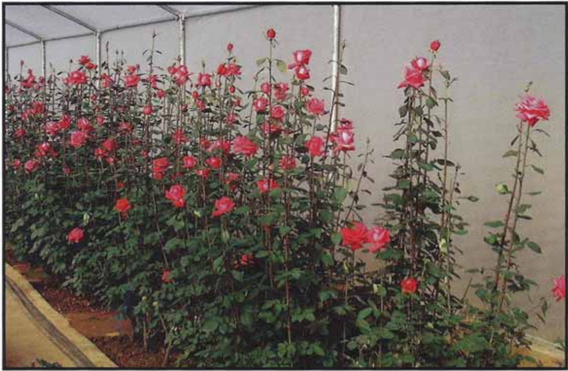
गुलाब की किस्म अर्जुन का पुष्प उत्पादन का दृश्य