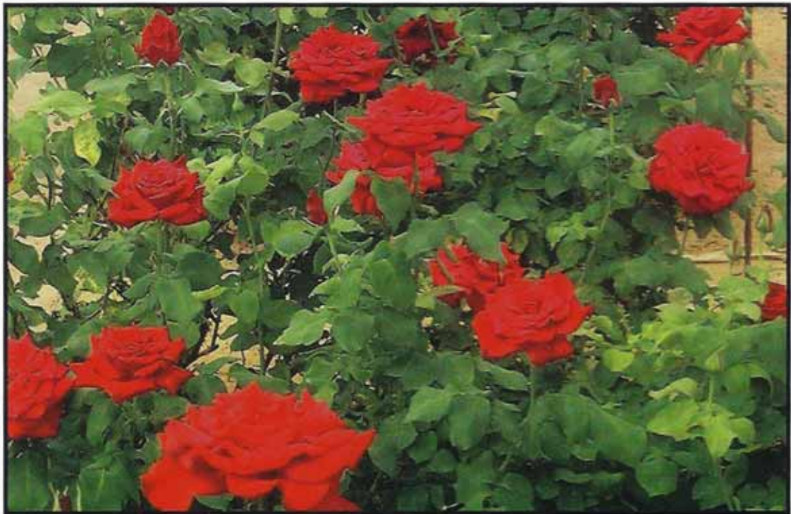
गुलाब की किस्म नेहरू सेंटिनरी का पुष्प उत्पादन का दृश्य