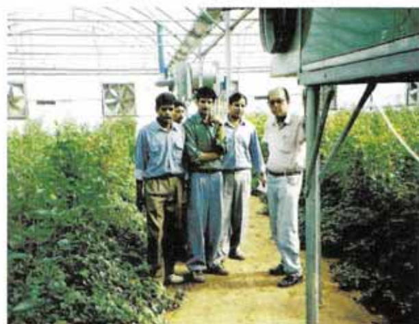
पॉलीहाउस में हाइब्रिड 'टी' गुलाब की किस्म स्टार लाइट का उत्पादन

इसके पौधों एवं पत्तियों का आकार छोटा होता है तथा यह छोटे फूल उत्पादित करते हैं। इस वर्ग के एक पौधा से काफी फूल उत्पादित होता है जैसे इसकी बेबी, पिक्सी, क्रीक्री, बेबीगोल्ड स्टोर आदि किस्में हैं।