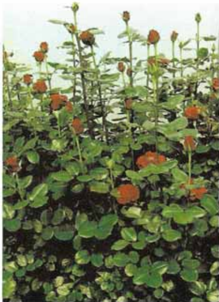
गुलाब का गुणवत्तायुक्त पुष्प उत्पादन

गुलाब के कर्तित पुष्प डण्डी को कली अवस्था जब एक या दो पुष्प की पंखुडी खुलनी शुरू हो जाए उस समय काटना चाहिए। इसके पुष्प डण्डी को कलीका अवस्था में काटते समय यह ध्यान रखना चाहिए कि कली बहुत कड़ी न हो अन्यथा ऐसे स्थिति में काटने के बाद गुलाब की कली नहीं खिल पाती है। गुलाब के पुष्प तेज दार वाले स्केटियर से काटना चाहिए तत्पश्चात् फूलों के कटे निचले भाग को साफ पानी में 5 से 6 सेंमी. डुबाकर रखना चाहिए ताकि फूल ताजा बना रहे। इसका कट फ्लावर काटने के बाद बाल्टी में रखने के पश्चात् शीतगृह में 4° सेंटीग्रेड में 5 से 6 घण्टे के लिए भण्डारण करने पर पुष्प अधिक दिनों तक तरोताजा बने रहते हैं। फूलों को शीतगृह उपचार देने के बाद विभिन्न वर्गों में पुष्प डण्डी के लम्बाई के आधार पर विभाजित कर लेना चाहिए। गुलाब के कर्तित पुष्प डण्डियों को 30 से 40, 40 से 50, 50 से 60, 60 से 70, 70 से 80, 80 से 90, 90 से 100, 100 से 110, तथा 110 से 120 सेंमी. लम्बी पुष्प डण्डियों में विभाजित किया गया है। पुष्प के ग्रेडिंग के बाद 20 फूलों का एक बंडल (बंच) बनाकर पुष्प डण्डियों के कलियों को कौरुगेटिड पेपर में रबड़ बैंड