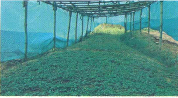
हिमबाला की पौधशाला

पत्तियाँ आ जाए तो उन्हें हिको ट्रे या पॉलीथीन में रोप देना चाहिए, जिसमें मिट्टी, रेत एवं खाद का अनुपात 1:1:1 का होना चाहिए। 4-5 महीने के दृढ़ीकरण के बाद पौध प्रतिरोपण के लिए तैयार हो जाती है।