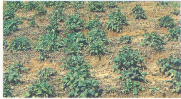
हिमबाला की फसल

पौध अन्तराल : पौध को पंक्तियों में लगाना चाहिए ताकि, अंतःकृषि कार्यो को करने में