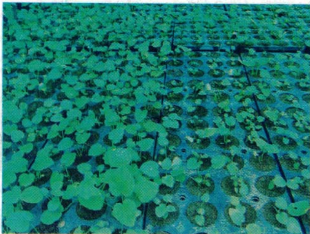
हिकोट्रे में हिमबाला की पौध

खेतों की अपेक्षा छायादार हिस्से में फसल लगाना अत्यधिक लाभदायक है। इस फसल को कृषि-वानिकी/ सामाजिक-वानिकी के साथ भी शामिल किया जा सकता है।