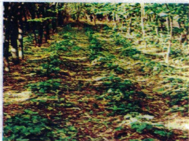
हिमबाला की अंतः-फसल

आर्थिकी : एक हे. भूमि में फसल लगाने की कुल लागत 1 से 1.1 लाख रुपये आती है। आगामी वर्ष लागत कम हो जाती है, क्योंकि पौध सामग्री पर होनेवाले खर्च को अपने आप पौध सामग्री तैयार करके कम किया जा सकता है। 2 वर्षों में हिमबाला से प्रति हेक्टेयर लगभग 1.25 लाख रुपये की शुद्ध आय प्राप्त की जा सकती है।